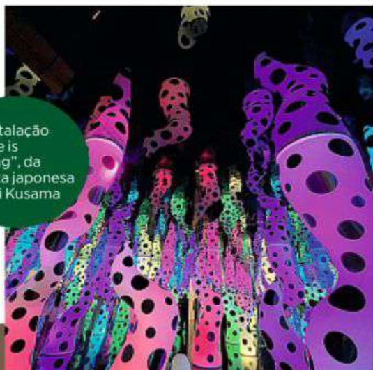
A instalação "Love is calling", da artista japonesa Yayoi Kusama