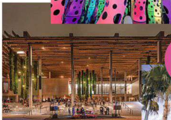
À esquerda, vista do PAMM. Ao lado, o Waterfront Park