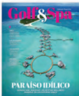
Golf & Spa julio/agosto 2023

Esperamos disfrutes cada página que hemos preparado en nuestro número 84.