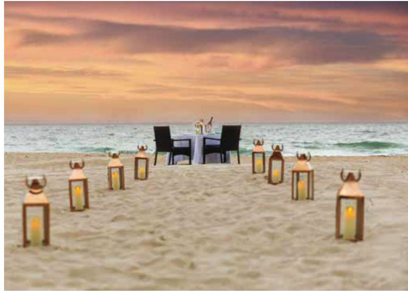
Acima, à esq., pratos inspirados na gastronomia do Oriente Médio do novo restaurante Abba; o italiano Carpaccio e o clássico americano Hillstone, todos no Bal Harbour Shops. Acima, foto do "Dinner Under the Stars", experiência oferecida pelo St. Regis Bal Harbour. Na pág. ao lado, fachada do francês Le Zoo, também no shopping; abaixo, a exposição Love is Calling , de Yayoi Kusama no Pérez Art Museum

a prática de exercícios e um playground com o tema "mãe Terra, ciclo da vida". A propriedade, de 6 mil metros quadrados, tem um espaço para eventos, uma área para se refrescar e paisagismo projetado por Raymond Jungles, além de uma cobertura em estilo de floresta que conduz os visitantes ao novo centro comunitário.