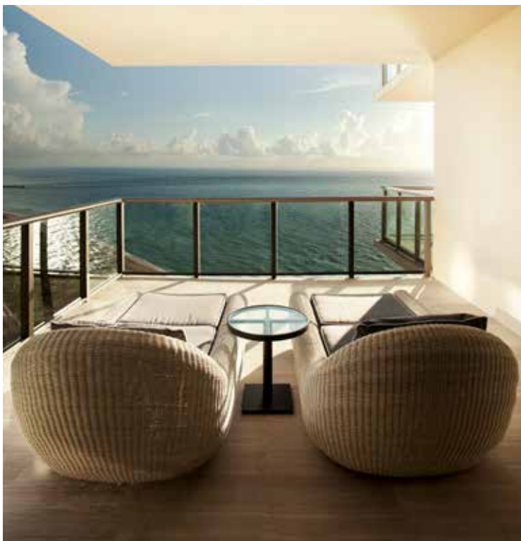
Слева: вид с балкона одного из люксов St. Regis Bal Harbour. Справа: когда в Бал-Харборе стояли военные, здесь регулярно проводили учения.